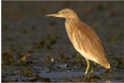
selyemgém (ezt fotózom a werkképen)