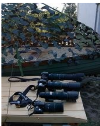
gépek sorakoznak a tutajon (még a százazföldön) bevetésre várva