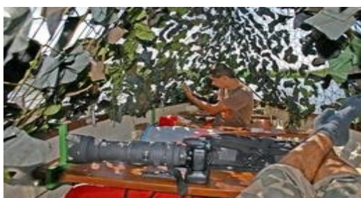
az erőd belülről